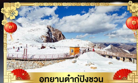
อุทยานต้ากู่ปิงชว่น