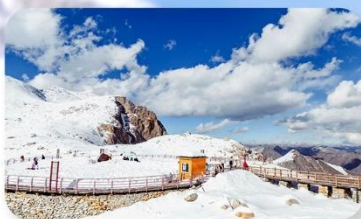
อุทยานต้ากู่ปิงชว่น