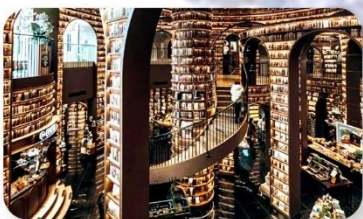
ร้านหนังสือจงซูเก๋อ