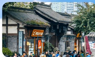
ถนนชอยกวางชอยแคบ