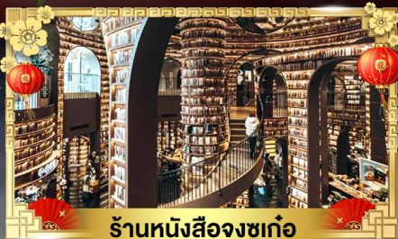
ร้านหนังสือจงซูเก๋อ