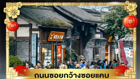
ถนนชอยกวางชอยแคบ